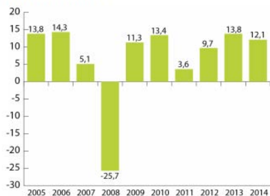
Évolution du Fonds 301 - RREGOP (en milliards de dollars)